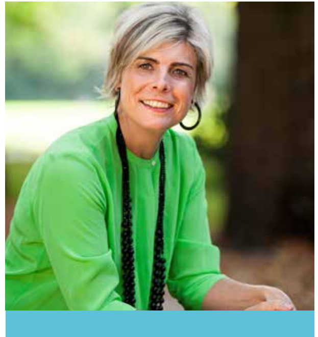
Laurentien van Oranje Onafhankelijk bestuurslid